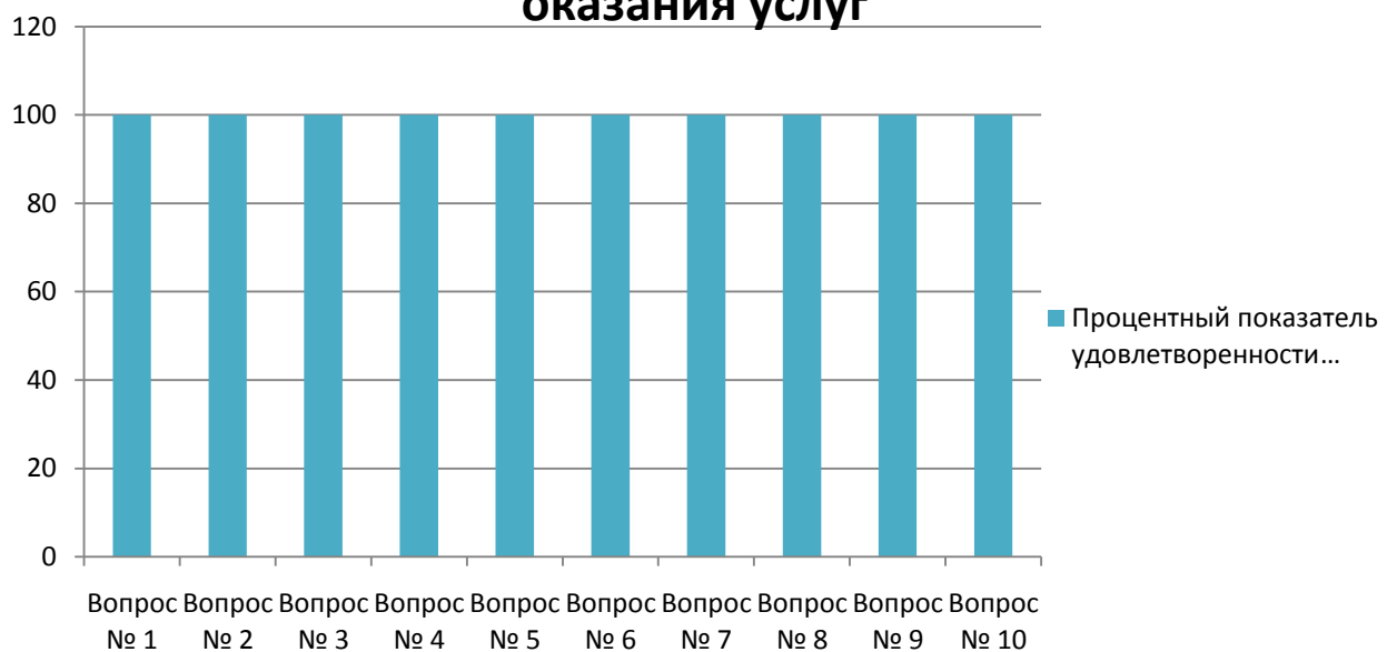
Диаграмма 1 независимой оценки качества предоставления услуг в ТОГБУСОН «Центр социальных услуг для населения города Кирсаново и Кирсановского района»(обзвон надомных потребителей)

Анкетирование получателей социальных услуг при непосредственном посещении учреждения (30 граждан опрошены интервьюерами) показало следующие результаты: